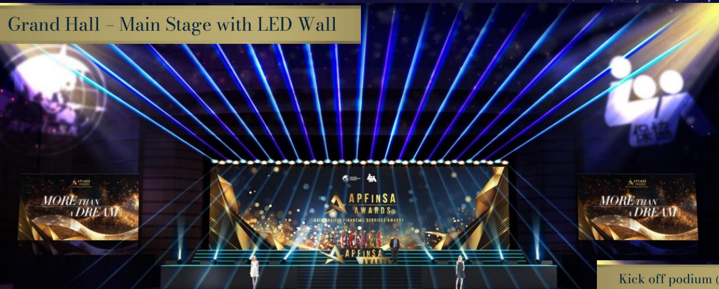
Grand Hall – Main Stage with LED Wall