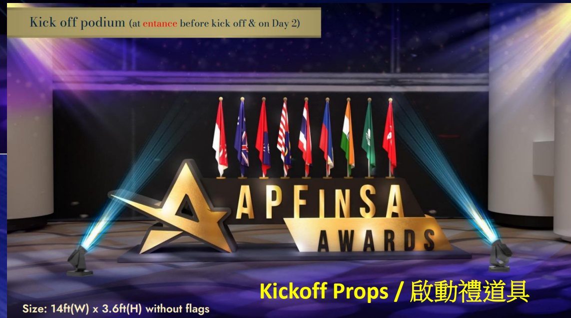
Kick off podium (at entrance before kick off & on Day 2)