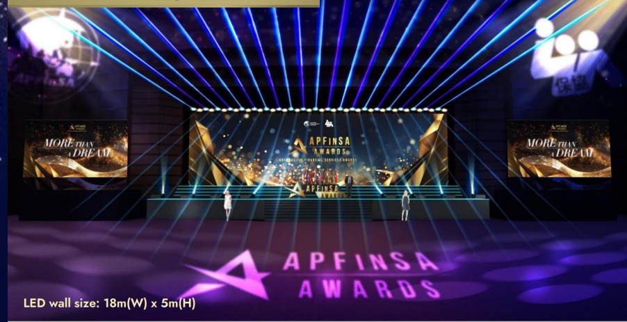
Grand Hall - Main Stage with LED Wall

17:30 – 20:30 Grand Hall / 主舞台 盛大開幕暨主講嘉賓分享