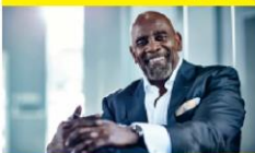
克里斯·加德納 (Chris Gardner)