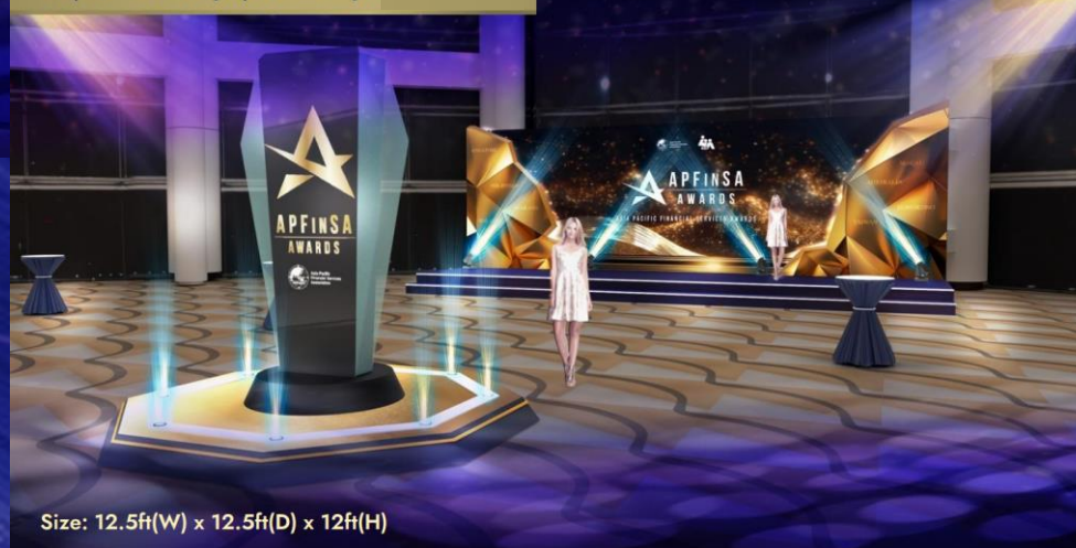
Size: 12.5ft(W) x 12.5ft(D) x 12ft(H)