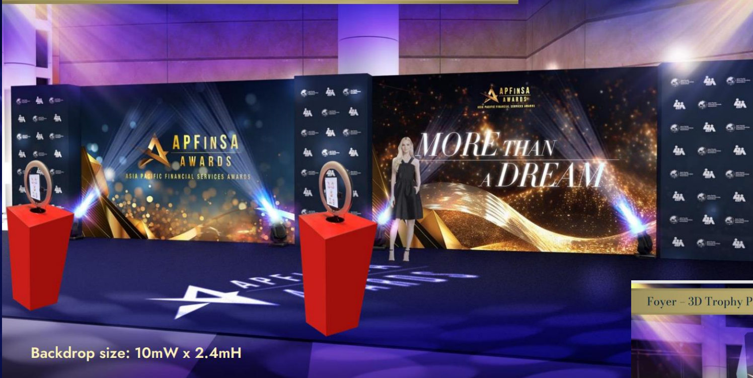
Backdrop size: 10mW x 2.4mH